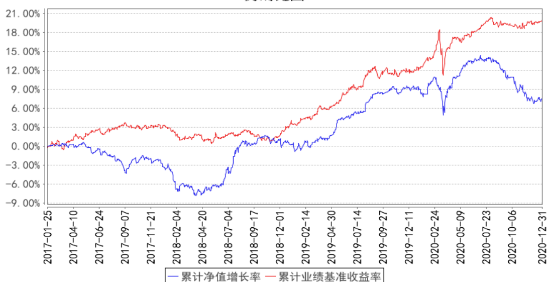
国富美元债定期债券（QDII）累计净值增长率与同期业绩比较基准收益率的历史走势对比图

注：上述对比图展示的是人民币份额累计净值增长率变动及其与同期业绩比较基准收益率变动的比较，本基金的基金合同生效日为 2017 年 1 月 25 日。本基金在 6 个月建仓期结束时，各项投资比例符合基金合同约定。