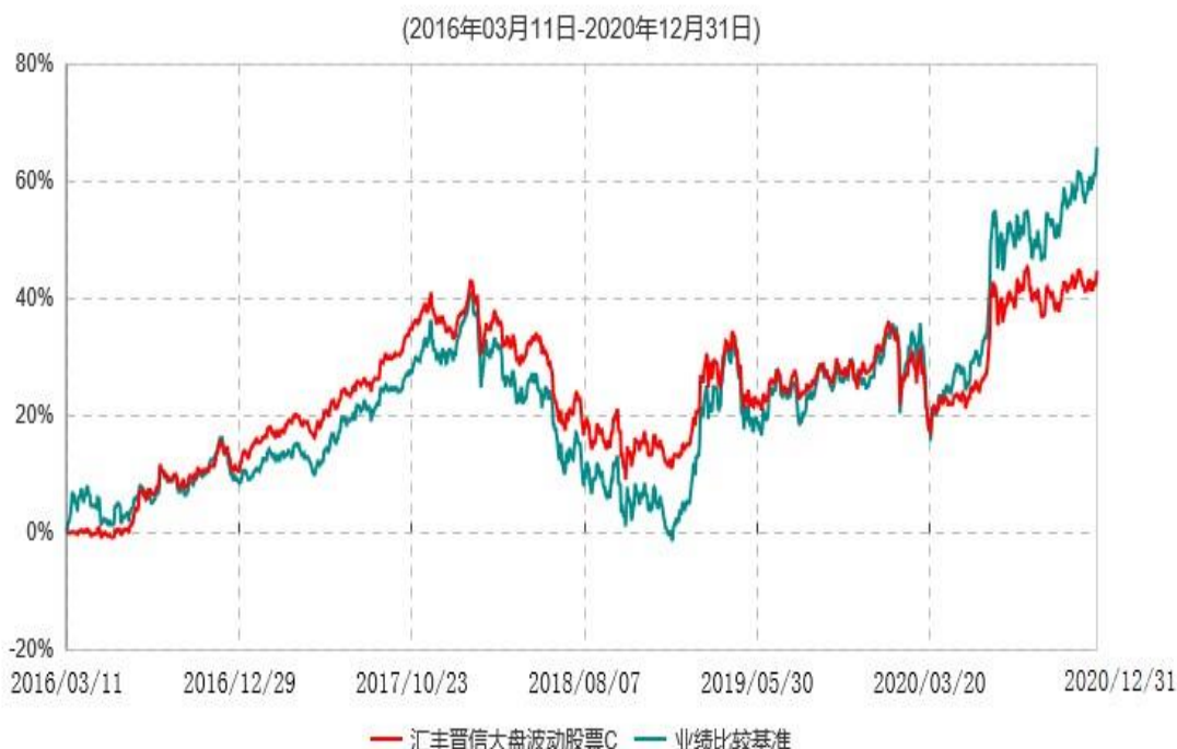
汇丰晋信大盘波动股票C累计净值增长率与业绩比较基准收益率历史走势对比图

同期业绩比较基准收益率的计算未包含沪深 300 指数成份股在报告期产生的股票红利收益。