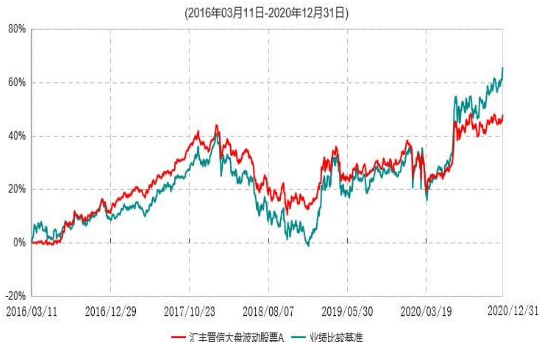
汇丰晋信大盘波动股票A累计净值增长率与业绩比较基准收益率历史走势对比图