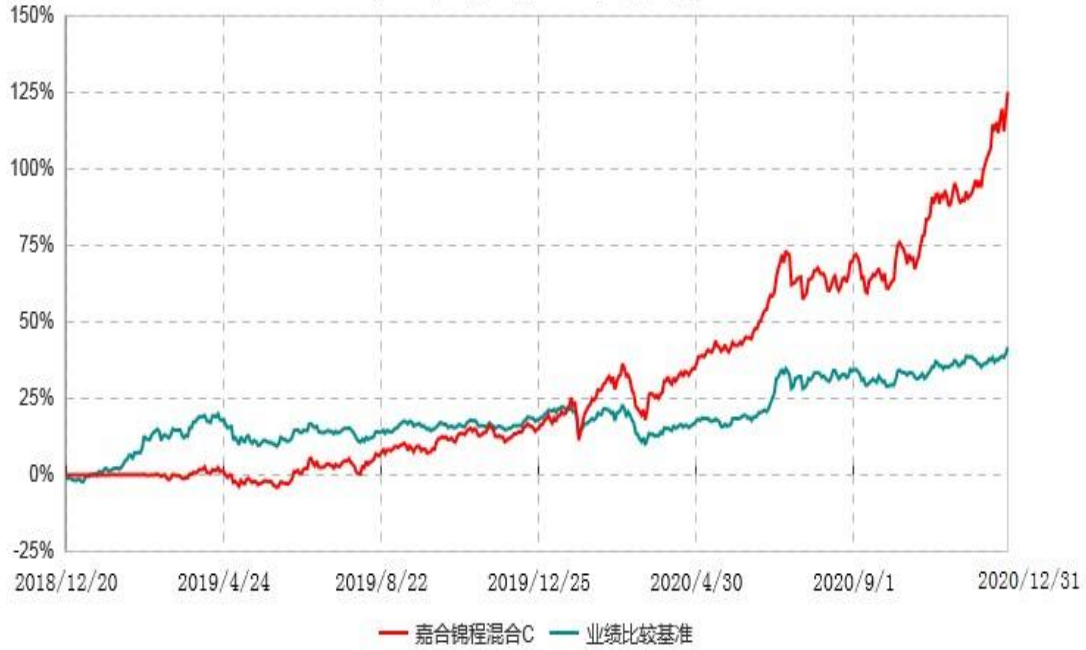
嘉合锦程混合C累计净值增长率与业绩比较基准收益率历史走势对比图 (2018年12月20日-2020年12月31日)