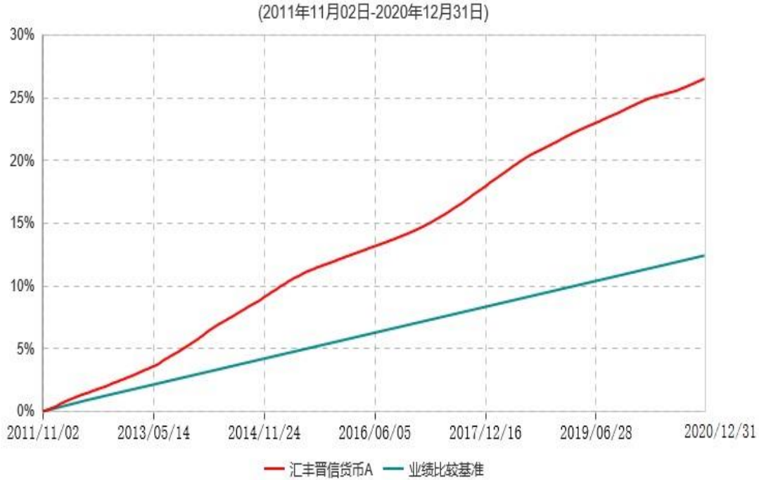
汇丰晋信货币A累计净值收益率与业绩比较基准收益率历史走势对比图