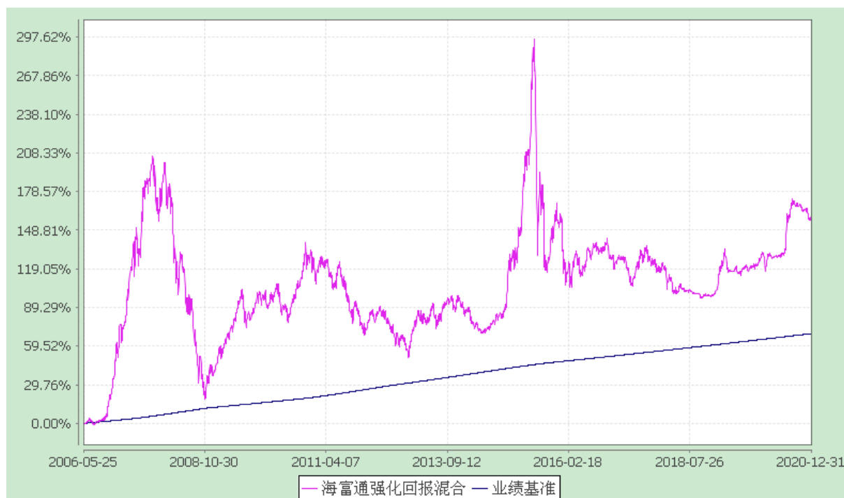
海富通强化回报混合型证券投资基金 份额累计净值增长率与业绩比较基准收益率的历史走势对比图 (2006年5月25日至2020年12月31日)

注：按照本基金合同规定,本基金建仓期为基金合同生效之日起六个月。建仓期满至今,本基金投资组合均达到本基金合同第十二条(二)、(七)规定的比例限制及本基金投资组合的比例范围。