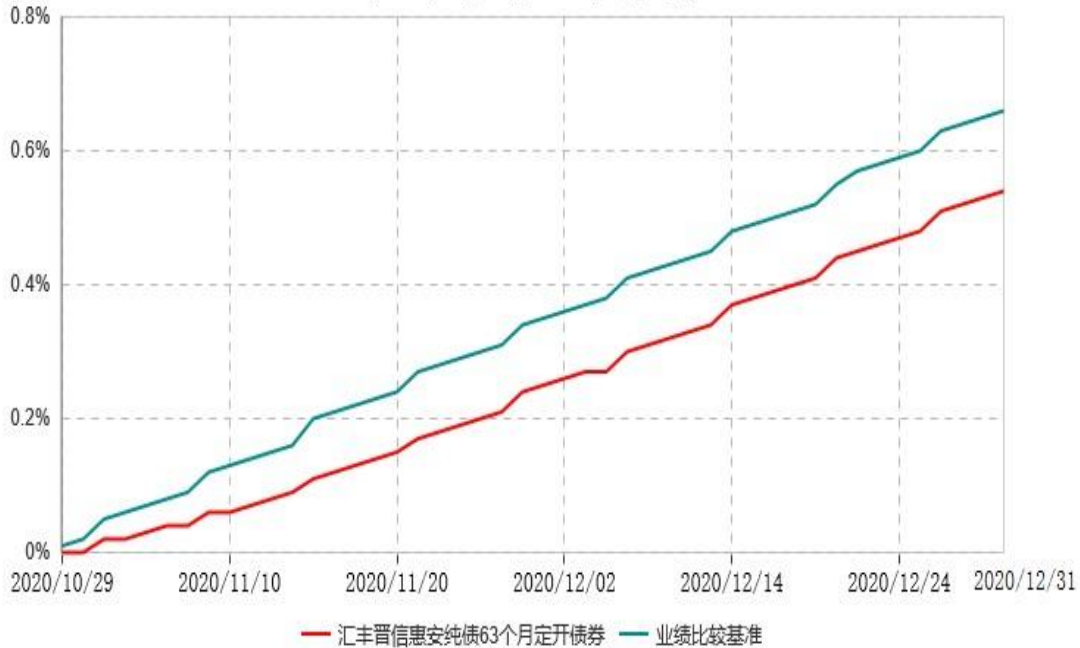
汇丰晋信惠安纯债63个月定期开放债券型证券投资基金累计净值增长率与业绩比较基准收益率历史走势对比图 (2020年10月29日-2020年12月31日)