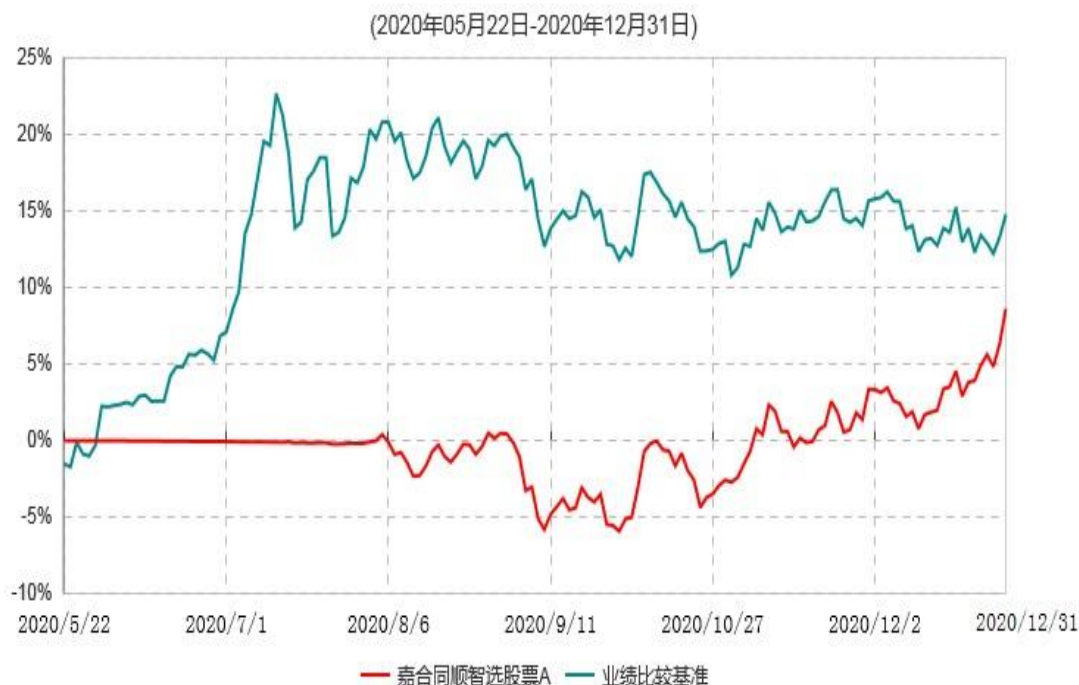
嘉合同顺智选股股票A累计净值增长率与业绩比较基准收益率历史走势对比图

注：1、本基金基金合同于 2020 年 5 月 22 日生效。截至本报告期末，本基金基金合同生效不满一年。