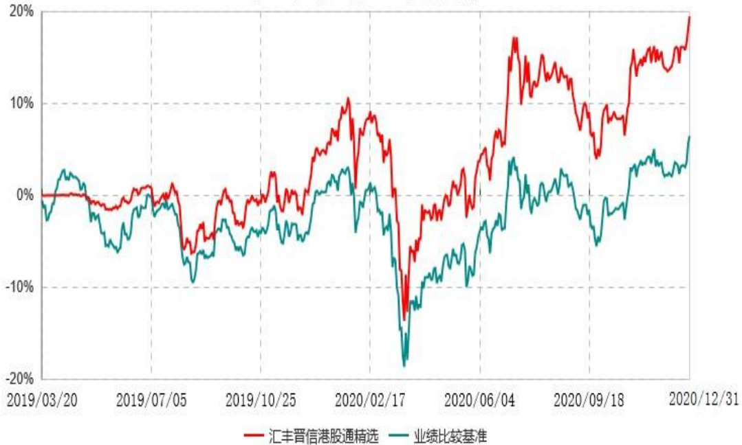
汇丰晋信港股通精选股票型证券投资基金累计净值增长率与业绩比较基准收益率历史走势对比图 (2019年03月20日-2020年12月31日)