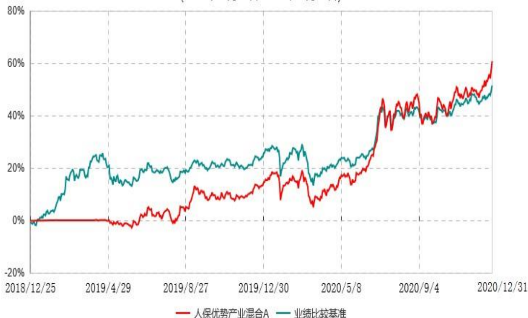
人保优势产业混合C累计净值增长率与业绩比较基准收益率历史走势对比图