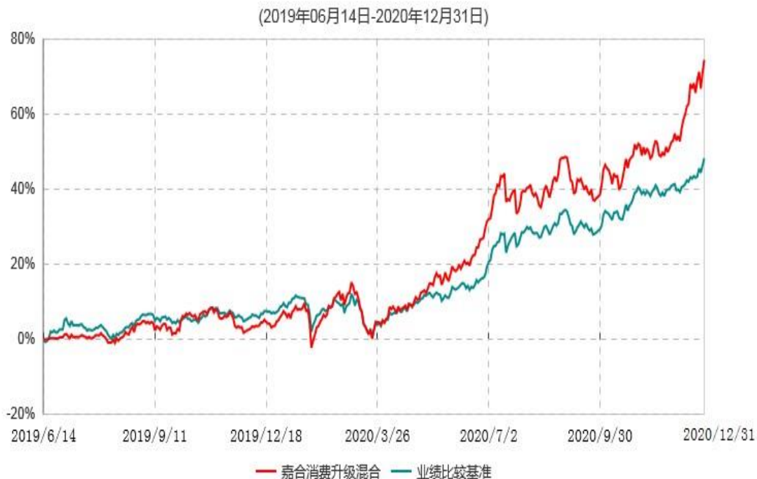
嘉合消费升级混合型发起式证券投资基金累计净值增长率与业绩比较基准收益率历史走势对比图