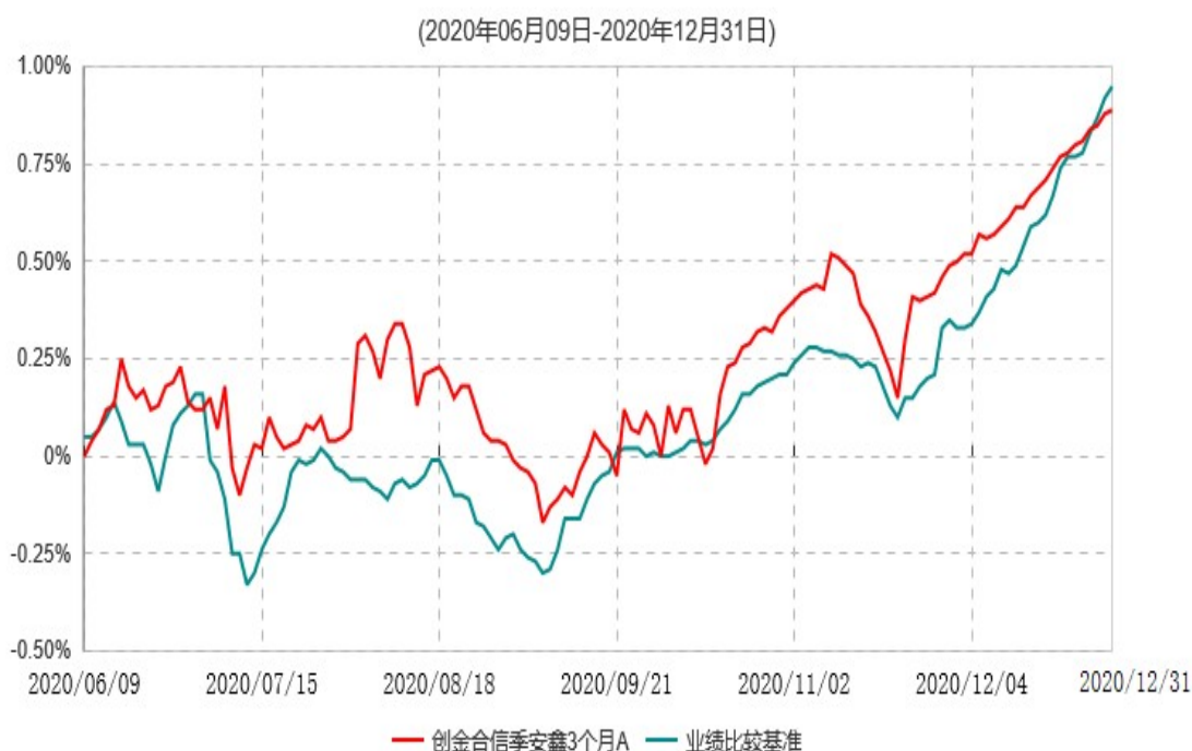
创金合信季安鑫3个月A累计净值增长率与业绩比较基准收益率历史走势对比图