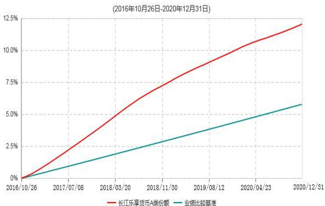
长江乐享货币A类份额累计净值收益率与业绩比较基准收益率历史走势对比图