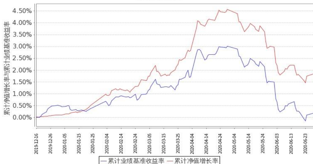
图 1：嘉实中债 3-5 年国开债指数 A 基金份额累计净值增长率与同期业绩比较基准收益率的历史走势对比图