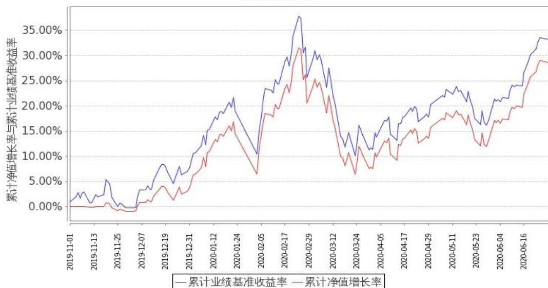
图 2：嘉实新兴科技 100ETF 联接 C 基金份额累计净值增长率与同期业绩比较基准收益率的历史走势对比图 (2019 年 11 月 1 日至 2020 年 6 月 30 日)