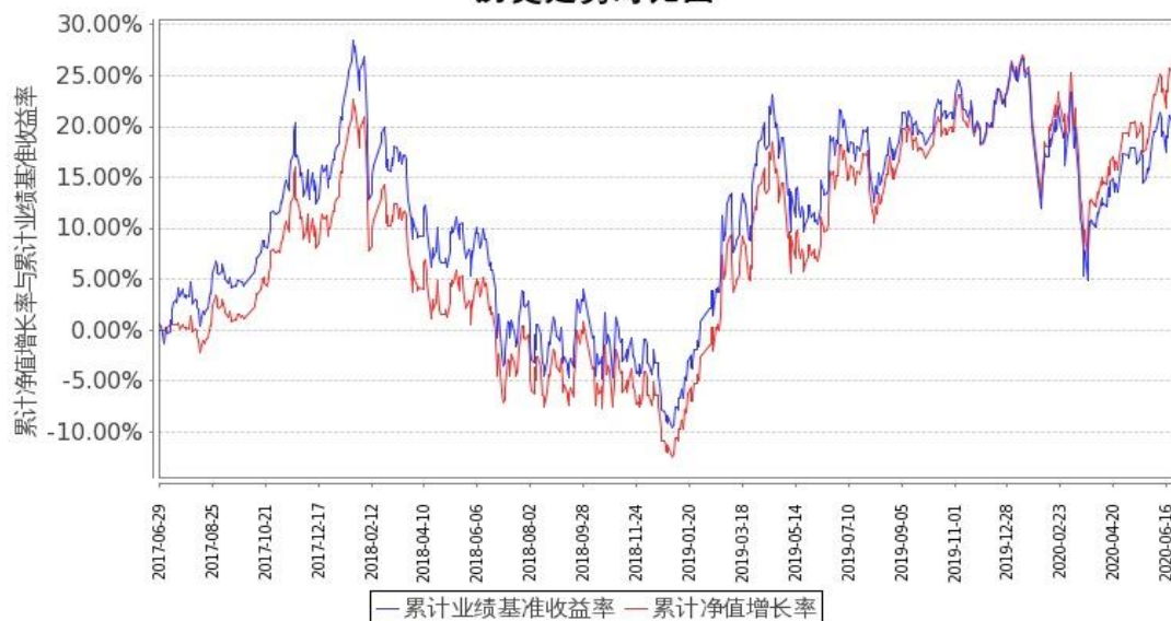
图 1：嘉实富时中国 A50ETF 联接基金 A 基金份额累计净值增长率与同期业绩比较基准收益率的