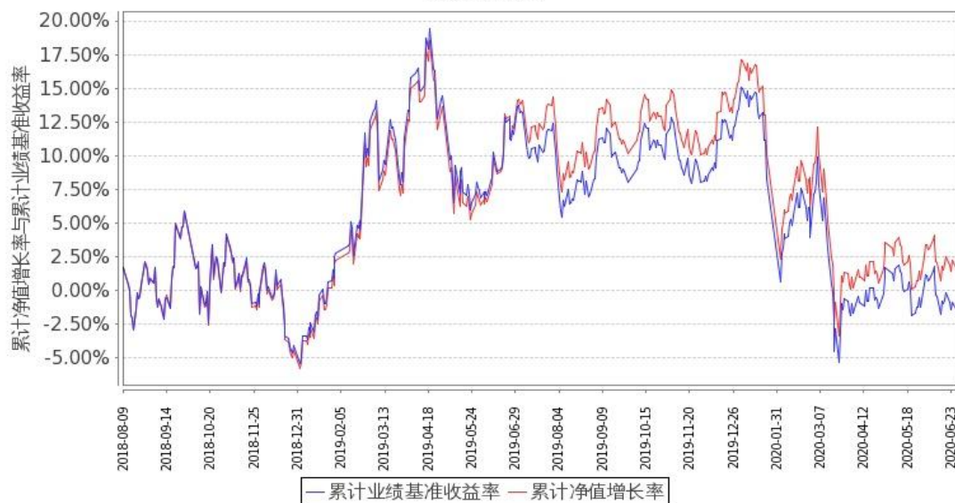
图 2：嘉实基本面 50 指数 (LOF) C 基金份额累计净值增长率与同期业绩比较基准收益率的历史走势对比图