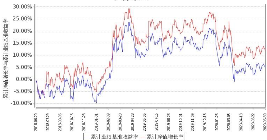
图 2：嘉实中证金融地产 ETF 联接 C 基金份额累计净值增长率与同期业绩比较基准收益率的历史走势对比图 (2018 年 6 月 20 日至 2020 年 6 月 30 日)

注：按基金合同和招募说明书的约定，本基金自基金合同生效日起 3 个月内为建仓期，建仓期结束时本基金的各项投资比例符合基金合同（十二（二）投资范围和（五）投资限制）的有关约定。