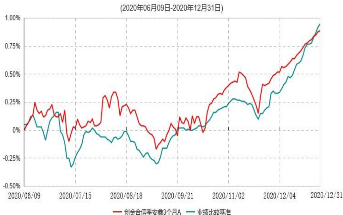
创金合信季安鑫3个月A累计净值增长率与业绩比较基准收益率历史走势对比图