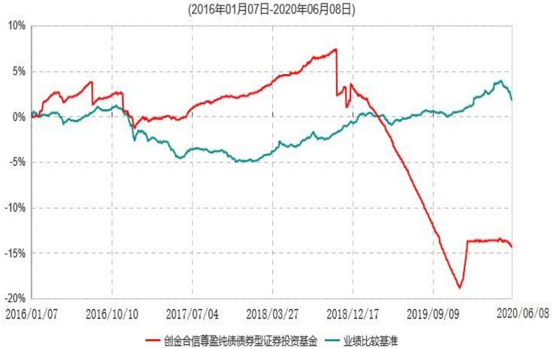
创金合信尊盈纯债债券型证券投资基金累计净值增长率与业绩比较基准收益率历史走势对比图