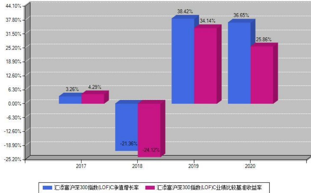
汇添富沪深300指数(LOF)C每年净值增长率与同期业绩基准收益率对比图

注：基金的过往业绩不代表未来表现。本《基金合同》生效之日为2017年09月06日，合同生效当年按实际存续期计算，不按整个自然年度进行折算。