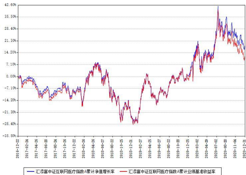
汇添富中证互联网医疗指数A累计净值增长率与同期业绩基准收益率对比图