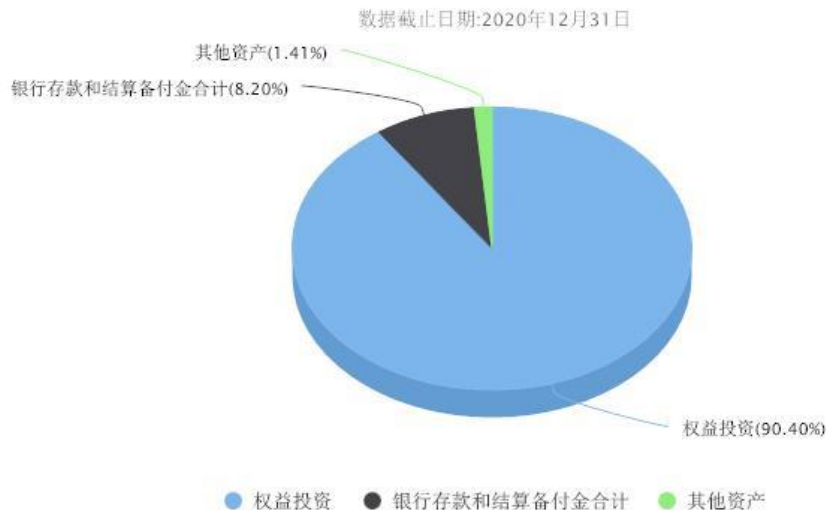
汇添富中证新能源汽车产业指数(LOF)C投资组合资产配置图表