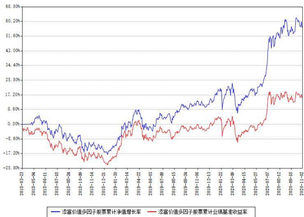
添富价值多因子股票累计净值增长率与同期业绩基准收益率对比图