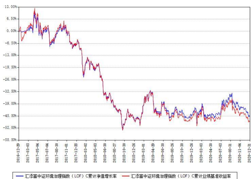
汇添富中证环境治理指数（LOF）C 累计净值增长率与同期业绩基准收益率对比图