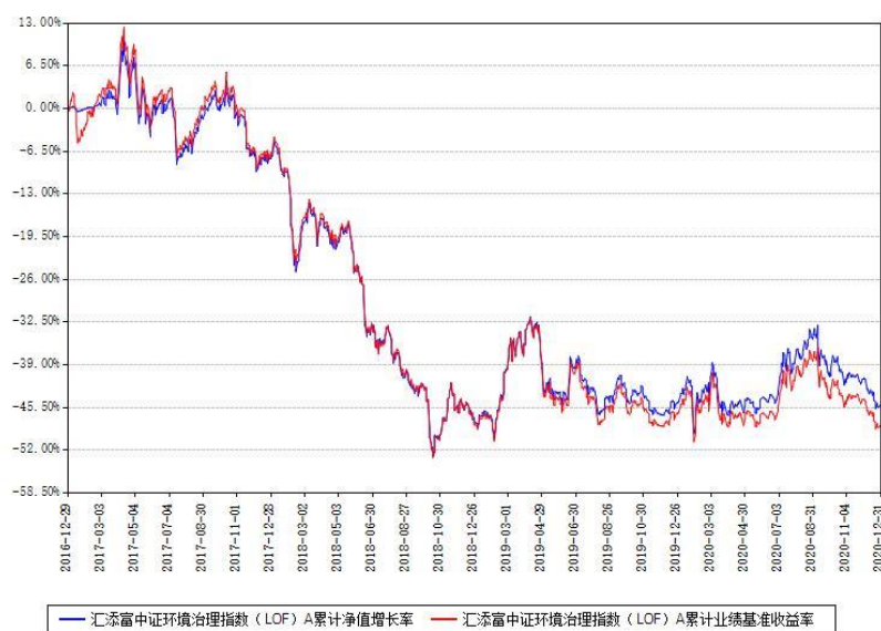
汇添富中证环境治理指数（LOF）A 累计净值增长率与同期业绩基准收益率对比图