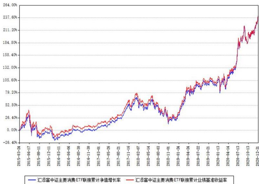
汇添富中证主要消费ETF联接累计净值增长率与同期业绩基准收益率对比图