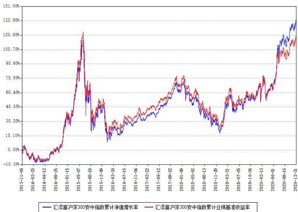
汇添富沪深300安中指数累计净值增长率与同期业绩基准收益率对比图