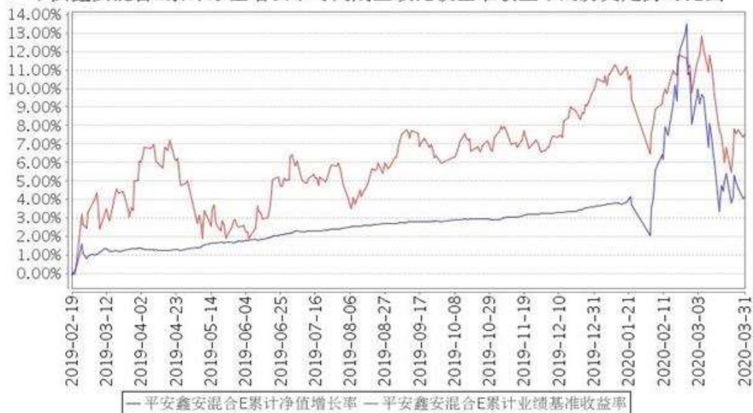
平安鑫安混合E累计净值增长率与同期业绩比较基准收益率的历史走势对比图