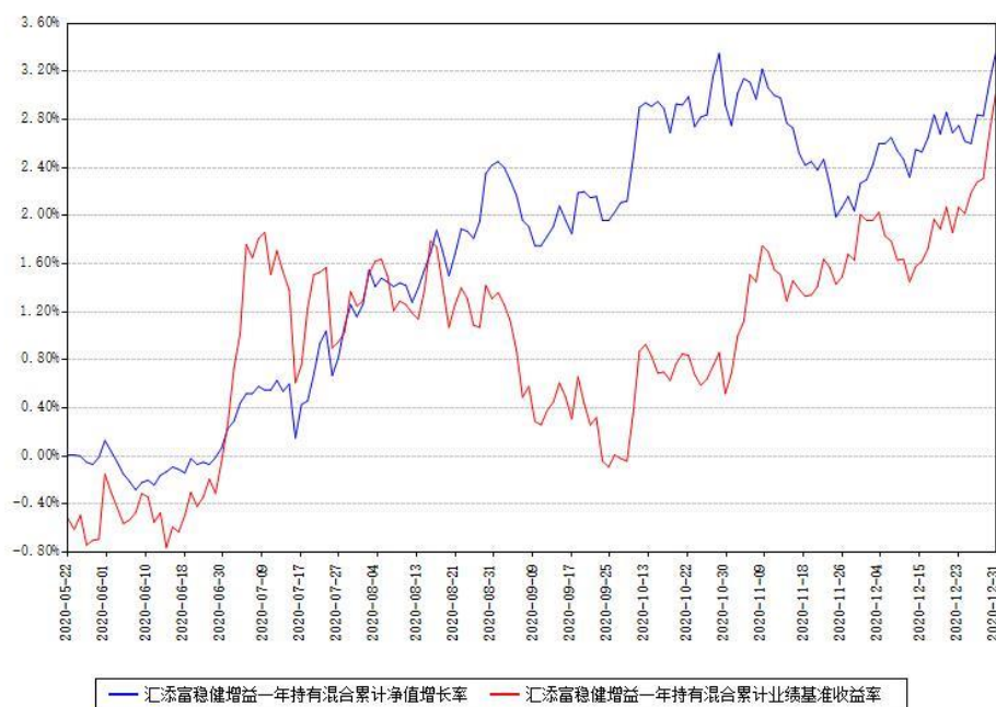
汇添富稳健增益一年持有混合累计净值增长率与同期业绩基准收益率对比图