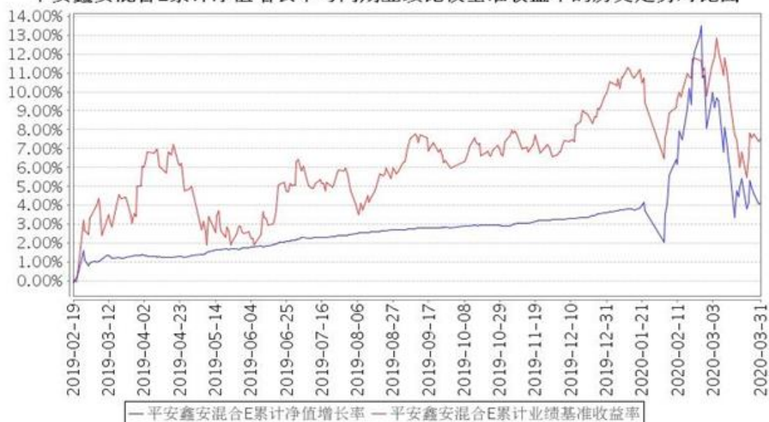
平安鑫安混合E累计净值增长率与同期业绩比较基准收益率的历史走势对比图