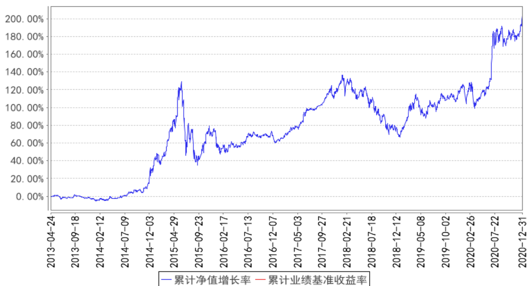
东方红新睿5号集合累计净值增长率与同期业绩比较基准收益率的历史走势对比图