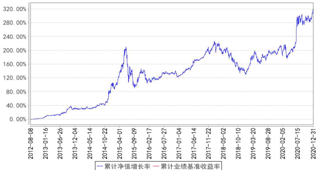
东方红新睿3号集合累计净值增长率与同期业绩比较基准收益率的历史走势对比图