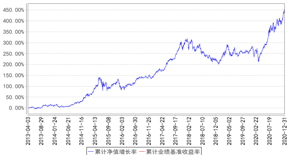
东方红领先趋势集合累计净值增长率与同期业绩比较基准收益率的历史走势对比图