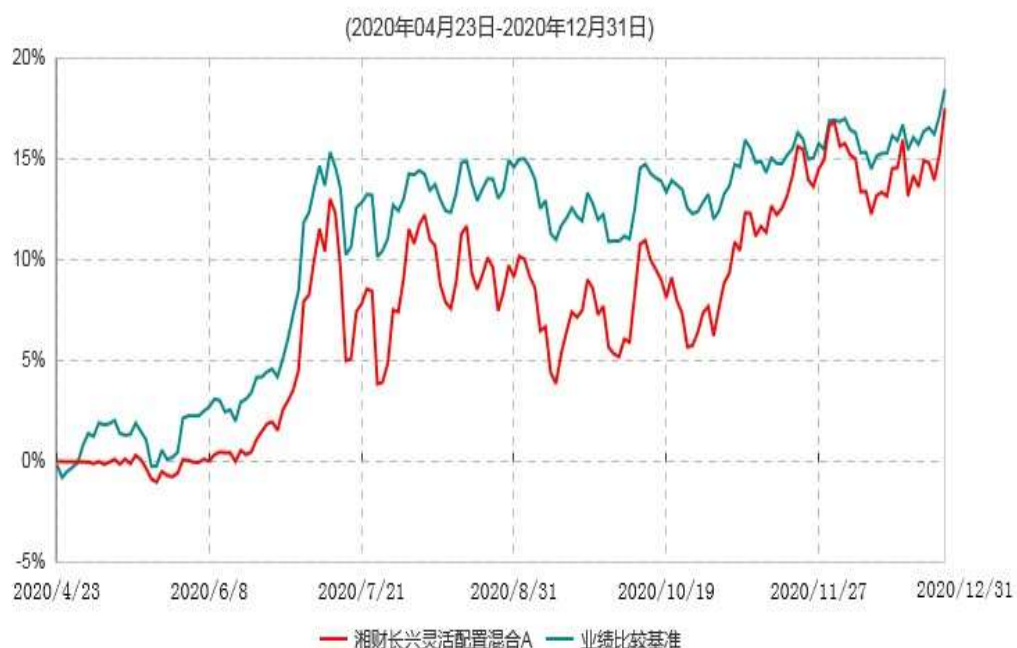
湘财长兴灵活配置混合A累计净值增长率与业绩比较基准收益率历史走势对比图

1、基金合同于2020年4月23日生效，截至本报告期末，本基金基金合同生效未满一年。