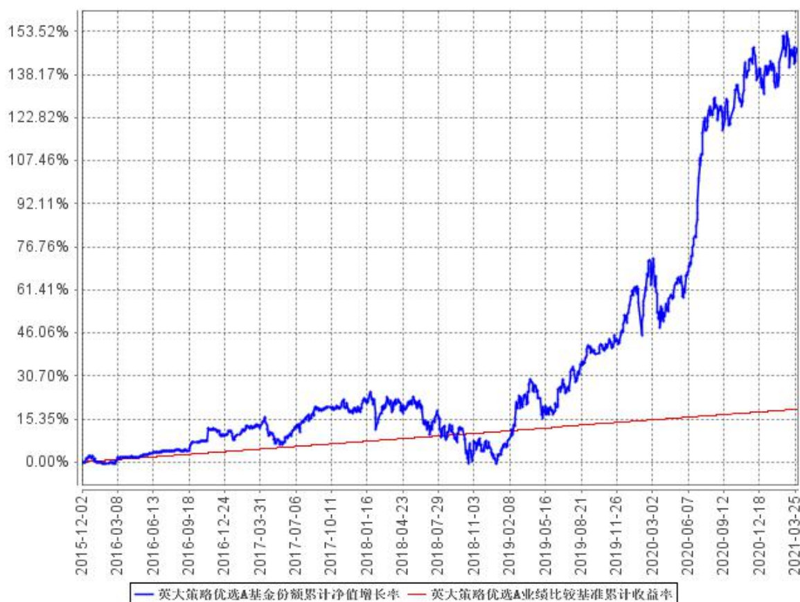
英大策略优选A基金份额累计净值增长率与同期业绩比较基准收益率的历史走势对比图