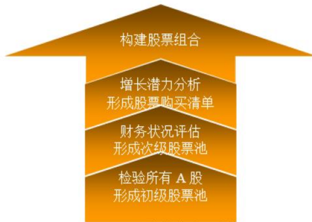
图：本基金选股流程

本基金基金经理将对股票购买清单上的股票进行逐一分析和比较，挑选出其中股价下跌风险最低且上涨空间最大的股票构建具体的股票组合。