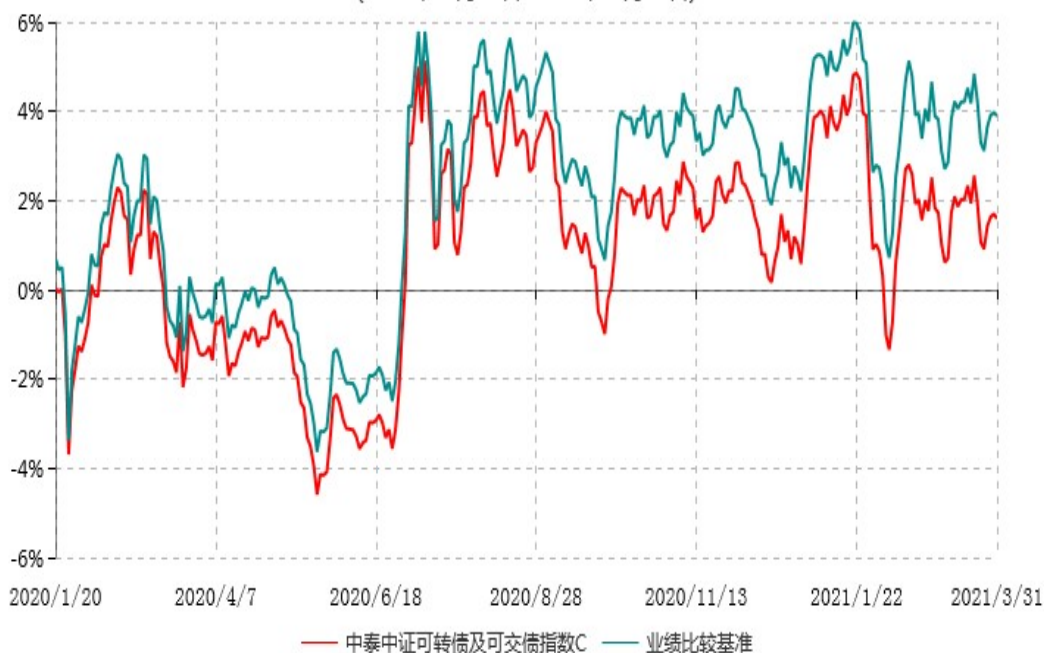
中泰中证可转债及可交换债券指数C累计净值增长率与业绩比较基准收益率历史走势对比图 (2020年01月19日-2021年03月31日)

注：根据基金合同约定，本基金自基金合同生效之日起 6 个月内为建仓期。建仓期结束时，本基金各项资产配置比例符合基金合同约定。