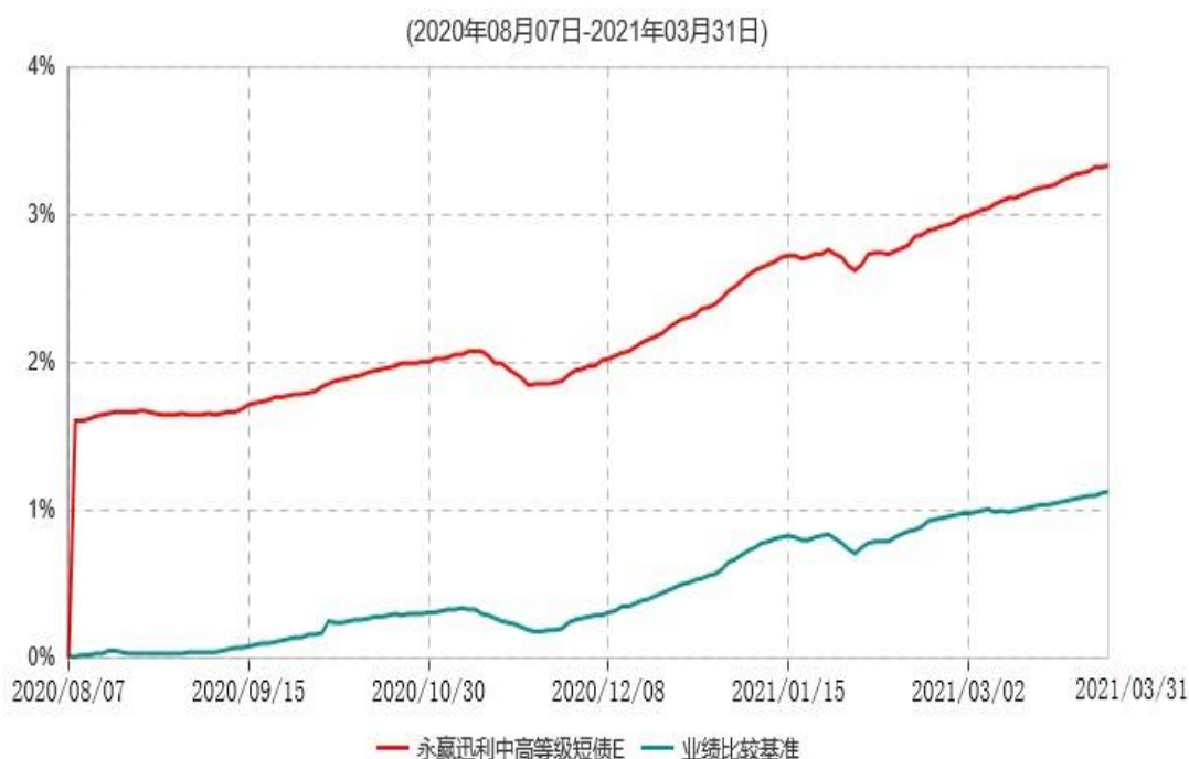
永赢迅利中高等级短债E累计净值增长率与业绩比较基准收益率历史走势对比图

注：本基金自 2020 年 8 月 7 日增设 E 类基金份额，截至本报告期末，本类基金份额生效未 1 年。