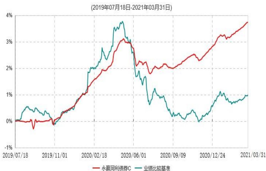
永赢同利债券C累计净值增长率与业绩比较基准收益率历史走势对比图