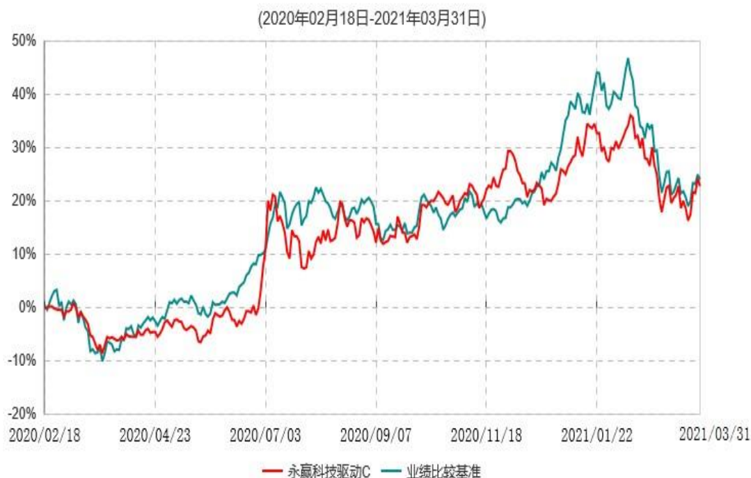
永赢科技驱动C累计净值增长率与业绩比较基准收益率历史走势对比图