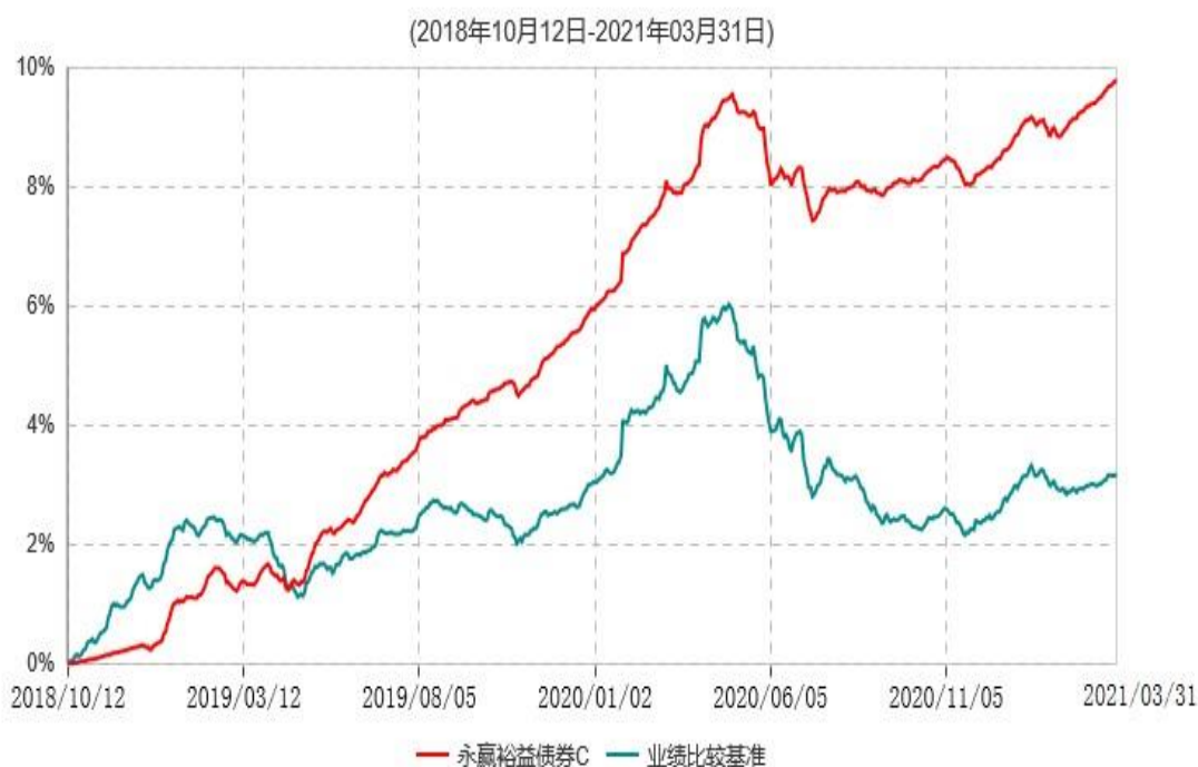
永赢裕益债券C累计净值增长率与业绩比较基准收益率历史走势对比图