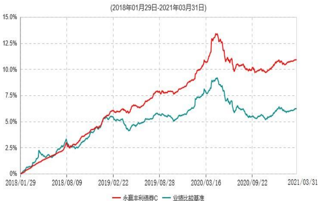
永赢丰利债券C累计净值增长率与业绩比较基准收益率历史走势对比图