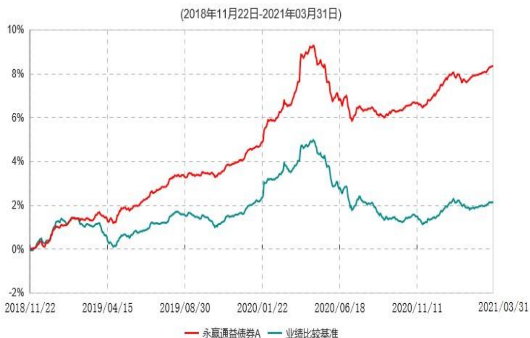
永赢通益债券A累计净值增长率与业绩比较基准收益率历史走势对比图