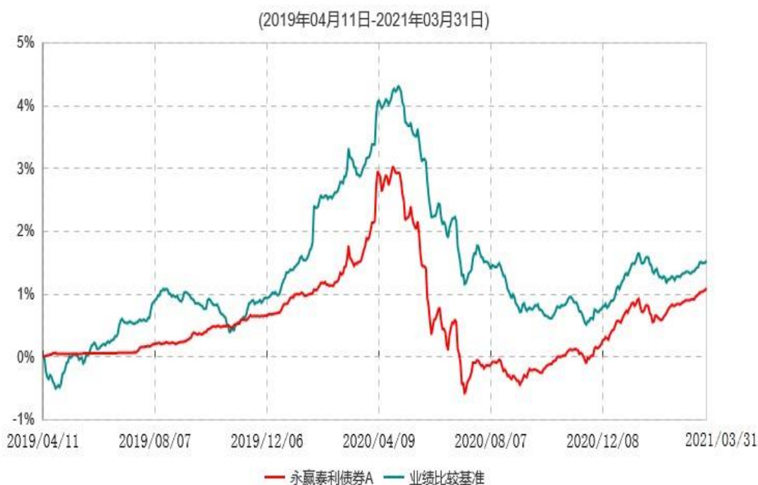
永赢泰利债券A累计净值增长率与业绩比较基准收益率历史走势对比图