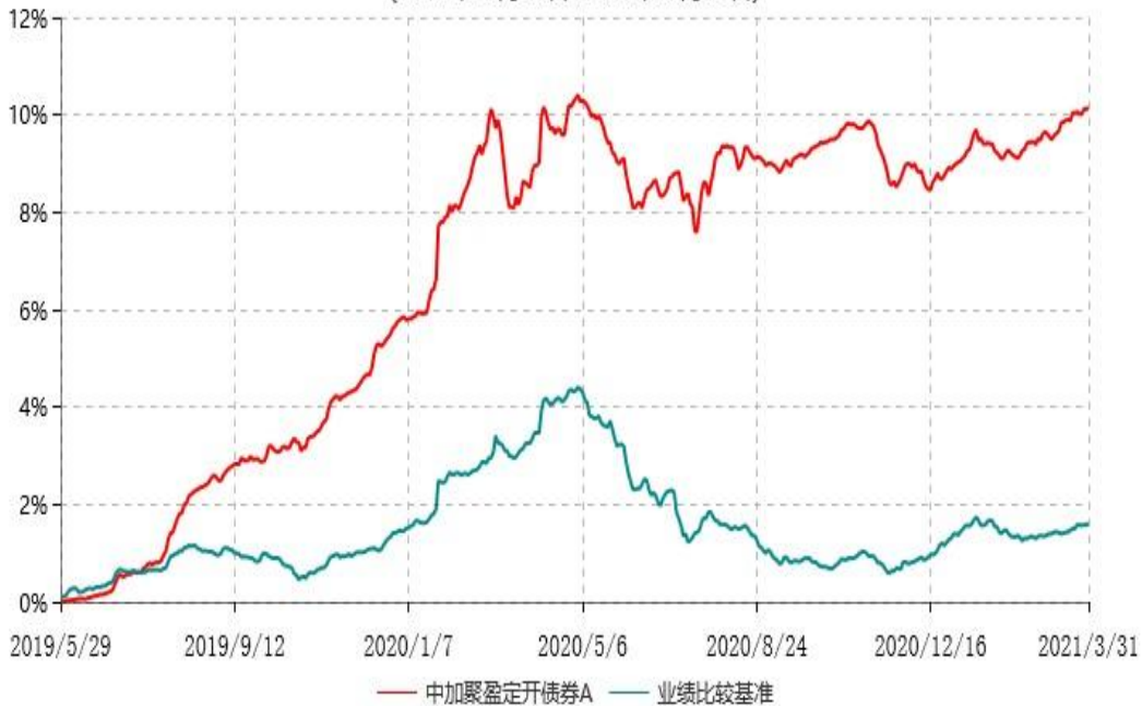
中加聚盈定开债券A累计净值增长率与业绩比较基准收益率历史走势对比图 (2019年05月29日-2021年03月31日)