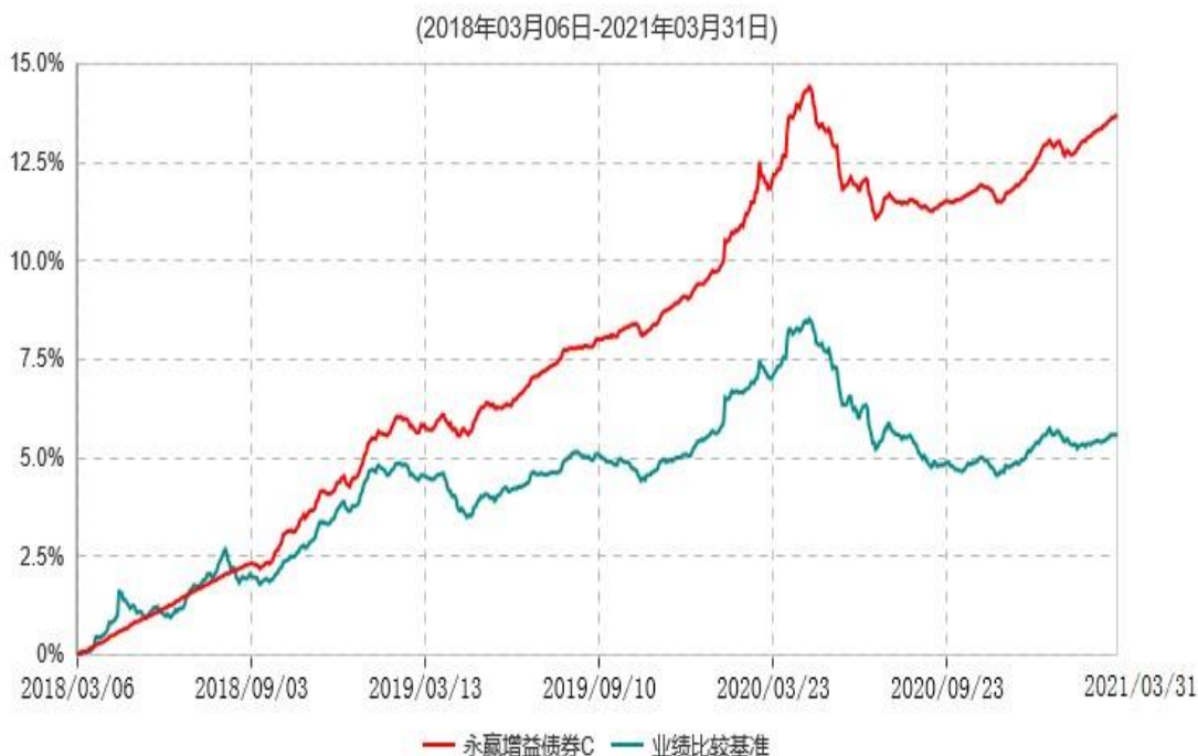
永赢增益债券C累计净值增长率与业绩比较基准收益率历史走势对比图

注：本基金建仓期为本基金合同生效日起 6 个月，建仓期结束当日，除债券投资比例未达到合同约定外，其他各项资产配置符合合同约定。债券投资比例未达到合同约定系交易对手原因导致现券买入交易结算失败所致，本基金于 2018 年 9 月 6 日及时买入债券将债券投资比例提高至合同约定的范围内。