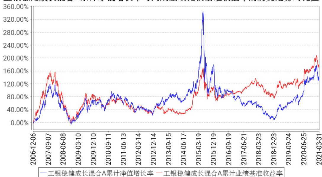
工银稳健成长混合A累计净值增长率与同期业绩比较基准收益率的历史走势对比图