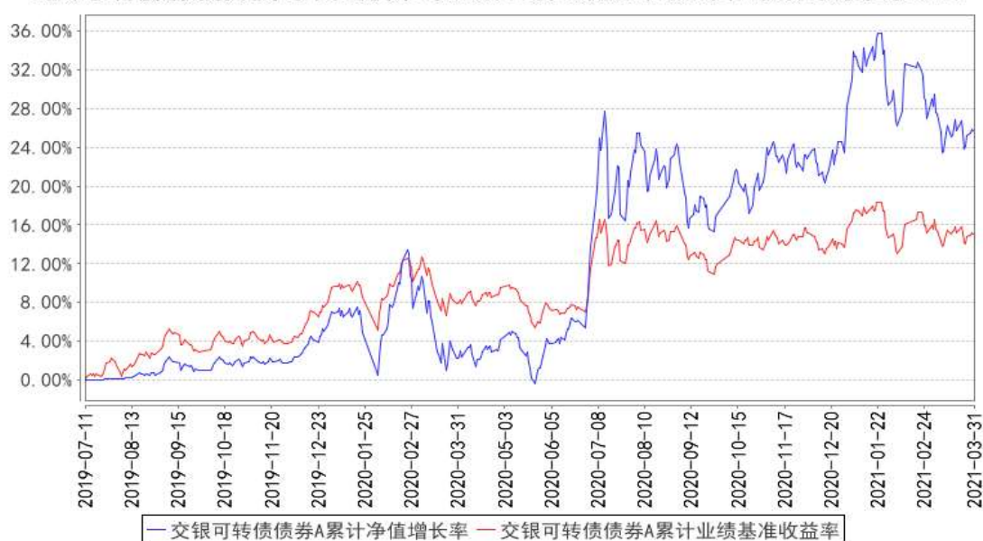
交银可转债债券A累计净值增长率与同期业绩比较基准收益率的历史走势对比图