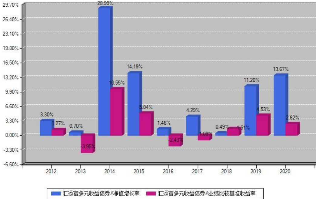
汇添富多元收益债券A每年净值增长率与同期业绩基准收益率对比图

注：基金的过往业绩不代表未来表现。本《基金合同》生效之日为2012年09月18日，合同生效当年按实际存续期计算，不按整个自然年度进行折算。