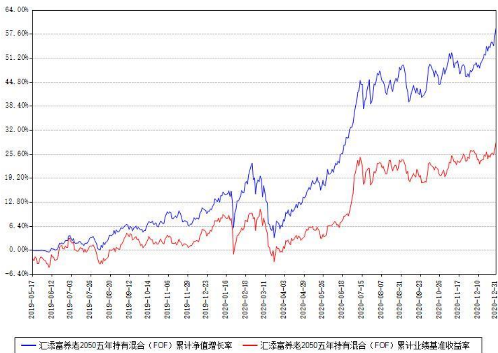
汇添富养老2050五年持有混合 (FOF) 累计净值增长率与同期业绩基准收益率对比图

(二) 自基金合同生效以来基金累计净值增长率变动及其与同期业绩比较基准收益率变动的比较图