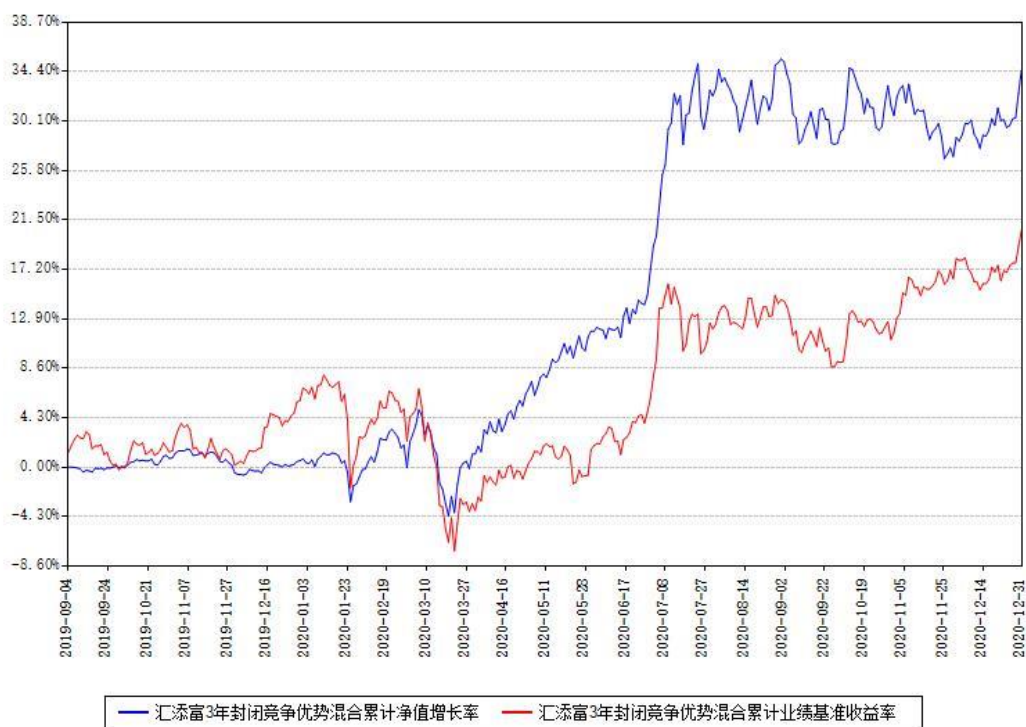
汇添富3年封闭竞争优势混合累计净值增长率与同期业绩基准收益率对比图

(二) 自基金合同生效以来基金累计净值增长率变动及其与同期业绩比较基准收益率变动的比较图