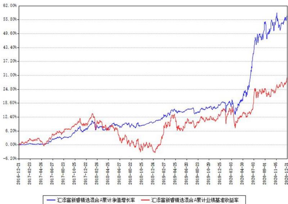
汇添富新睿精选混合A累计净值增长率与同期业绩基准收益率对比图